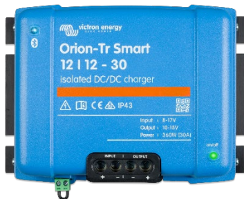
Orion-Tr Smart no aislado 12/12-30